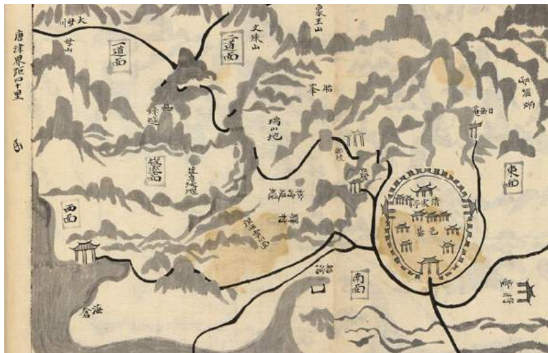
<도 2> 『호서읍지』(1895년)의 해미지도

현재 <표 1>의 동쪽 11리와 <도 2>에 표기되어 있는 비슷한 위치에 안흥정의 옛터와 지명이 남아 있다. 이곳은 현 충남 서산시 해미면 산수리 한서대학교 부근에 해당된다. 52) 따라서 이 안흥정도 실제 있었던 정이라 하겠다. 이제 태안 馬島 안흥정을 살펴보도록 하겠다. 다음은 『고려도경』의 관련 내용이다.